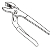
Groove Joint Pliers